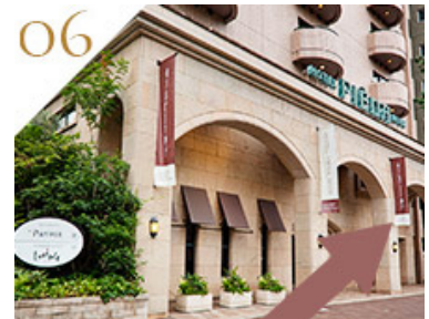
少し進むとホテルピエナ神戸が見えてきます。