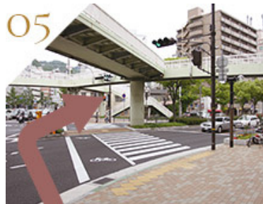
大きな歩道橋のある交差点を渡り、右に曲がります。