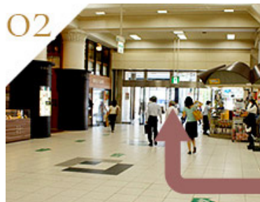
「DELI CAFE」を過ぎて外に出ます。