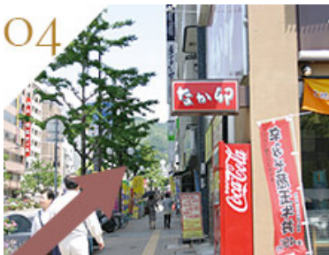
「なかが卯」を右手に、直進してください。