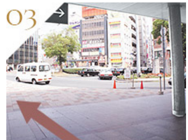
タクシーロータリーを右に見て直進します。