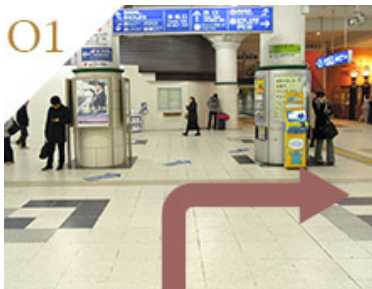
中央口改札を出て、そのまま右に曲がります。